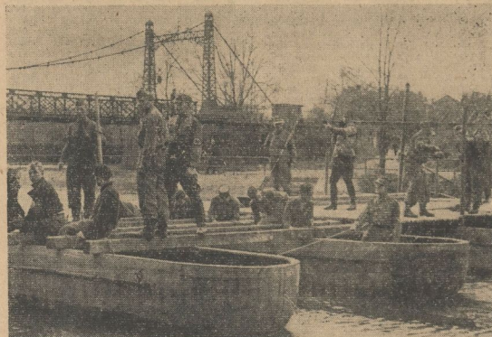
Mit einem besonderen Einsatz für das Kriegs-WHW, wartete in der Gaustadt Halle die SA. auf. Sie baute eine Pontonbrücke über die wilde Saale. Wer über sie hinwegschreiten wollte, hatte seine Spende zu entrichten.

Musik und Bühnenkuren, Brückenbau, Reiten, vorzügliche Stimmung beim Sammeln fürs Kriegs-WHW, 1940/41