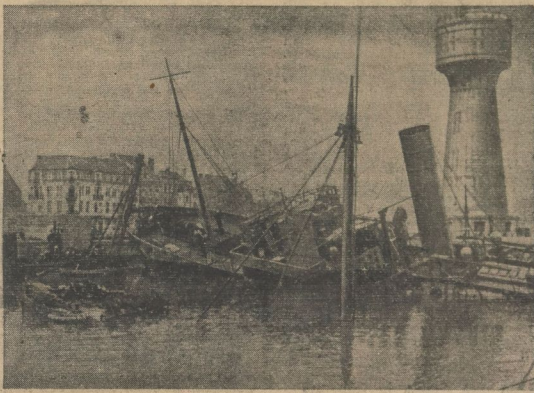
Versenkter feindlicher Transporter in einem englischen Hafen an der Kanalküste. So versinkt jetzt auch in englischen Häfen Schiff um Schiff unter den Schlägen der deutschen Luftwaffe.

Die Entmischung aber das Ausbleiben der englischen Hilfe und über die Erklärung der Türkei als nichtkriegsfähig, hat zum Stimmungsumschwung in gleicher Weise beigetragen, wie die jetzt auftretenden Organisationsmängel. So ist Saloniki bereits seit Tagen ohne Proviant. Während in allen griechischen Städten zum Teil auch infolge des hemmungslosen Freiheitskämpfers und levantinischer Spekulationen Mangel an lebenswichtigen Waren zu verzeichnen ist.