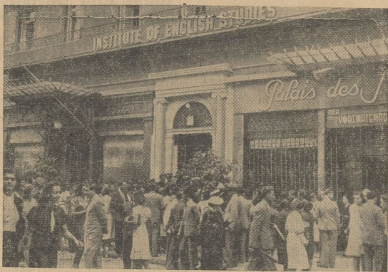
Ein neuer Beweis für die Englandhörigkeit Griechenlands. Unter dem Deckmantel sogenannter Sprachschulen hat England schon seit langem in Griechenland geheime Umrtriebe durchgeführt. Der Umrtrieb wurde für die Dauer des Semesters gegen eine ganz geringe Gebühr erteilt.