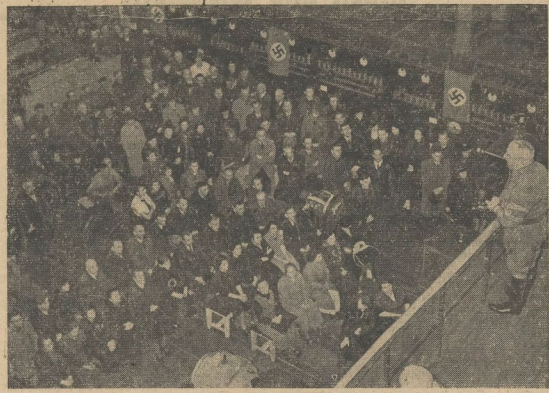
Dr. Ley über das kommende Sozialwerk Reichsorganisationsleiter Dr. Robert Ley sprach auf dem Betriebsappell eines Berliner Werkes über das in Vorbereitung befindliche deutsche Sozialwerk. Unser Bild: Reichsorganisationsleiter Dr. Ley während seiner Rede

Berlin, 8. Nov. 488 mal fanden 518 zum Kriegsjahres 1940 die Mikrophone des Großdeutschen Rundfunks an. Stätten deutscher Arbeit. Allein 247 verlebendene Werkstätten in der Reichsorganisationen aus Betrieben wurden vom Rundfunk nach Ausbruch des Krieges durchgeführt. 187mal fanden nach Kriegsausbruch die Mikrophone darüber hinaus in verlebendenden Betrieben, um vom Rundfunk der schaffenden Menschen an der Front der Arbeit zu berichten. In den ersten beiden Kriegsjahren führte der Rundfunk weiterhin 108 Reichsorganisationen mit der Deutschen Arbeitsfront durch, in denen alle wichtigen sozialen Maßnahmen behandelt wurden, deren Kenntnis für den schaffenden Menschen von Bedeutung ist.