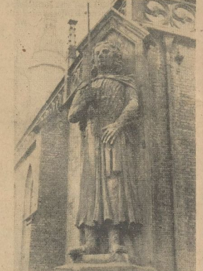
Der Roland am Roten Turm, uraltes Sinnbild der Gerechtnahme

er als solcher in damaliger Zeit (um 1230) im Uremium des Schiffmanns eine beson- dere Stellung einnahm, erheben wichtige, überlieferte Urkunden. Es erob sich nun die Frage, ob die Rechtsaufzeichnung des belagten Halle-Neumarkter Rechts ins 12. oder 13. Jahrhundert gehört, also ob sie vor Erlaß von Herpos Sachverständigen fällt oder nicht. Dr. Hünicken hat in langwieriger Arbeit festgestellt, daß dem von unserer Stadt ausgehenden Recht die geschichtliche Priorität gebührt. Das Halle-Neumarkter Recht wurde 1235 aufgestellt!