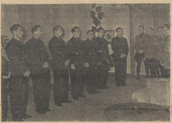
Eine Abordnung der rumänischen Legionäre in Berlin Die Abordnung der rumänischen Legionäre, die sich gegenwärtig auf einer Besuchsfahrt in Deutschland befindet, wird im Haus der Reichsjugendführung durch Reichsjugendführer Axmann (rechts) begrüßt