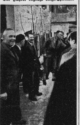
Der Führer begrüßt Kdg.-Sportler. Eine größere Gruppe von Kraft-durch-Freude-Sportlern...