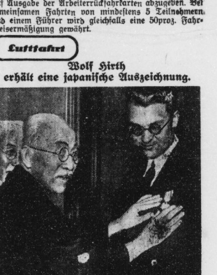
Der König der Segelflieger, so wird Wolf Hirth im Japan genannt. Für hervorragende Leistungen im Segelfliegen wird er hier mit einem Orden ausgezeichnet.