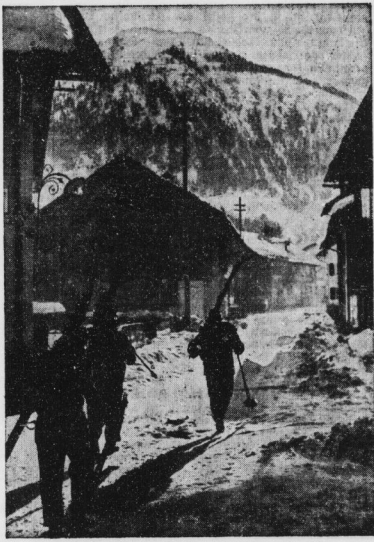
Oberstdorf im Allgäu: Aufbruch zum Skilau.

Unsere lieben Gäste aber aus dem Auslande, die uns in den kommenden Tagen der Olympischen Winterpiele in Garmisch-Partenkirchen die Ehre ihres Besuches spenden, werden — denn sind wir gewohnt — in den herrlichen Bergen und Tälern der deutschen Alpen in Oberbayern in ihrem Winter-