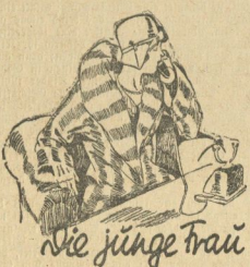
Die junge Frau

... was ich mir wünsche, möchtest Du wissen? Das ist die schönste Frage, die man an eine Frau stellen kann. Ich will sie beantworten — ohne jede Hemmung. Und wenn ich die Wünsche zum Weihnachtstag nicht alle erfüllen kann, bin ich nicht traurig. Es gibt so viele nette, so viele Oestgenheiten zum Schenken. Aber nun höre: Du habe nicht Zeit zum Anziehen. Bitte, diesmal kommt es. Oder verlangst Du, daß ich zu den Weihnachtstübchen im tiefen, zu farzen Kleid vom vergangenen Jahre gehe? Ich wünsche mir ein langes, elegantes Kleid, Größe 42 — immer noch —, eng anliegend in der Taille und bezaubernd weit im Bolant, mindestens zehn Meter weit. Und dazu in passender Farbe Seidenstrümpfe. Ist