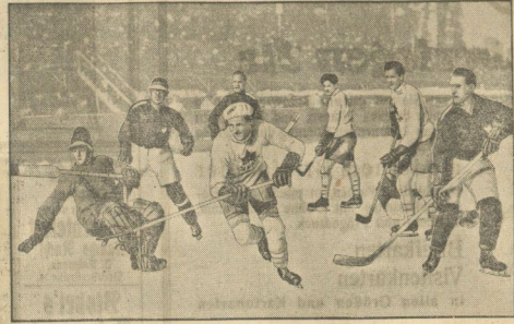
Die kanadischen Eishockeyspieler im Kampf um die Scheibe. Die Toronto-Rangers, die aktuellen Meister auf der linken Seite, die die rasche und leidenschaftliche Eishockeyspiel in seiner vollendetsten Form zeigen, sind in England zu ihrer mehrtägigen europäischen Tournee eingetroffen, die sie auch nach Berlin führen wird.