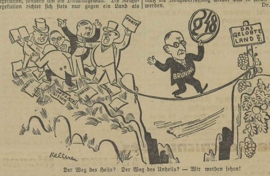
Der Weg des Heils? Der Weg des Unheils? - Wir werden leben!

24. Die von dem Reichspräsidenten getroffenen Maßnahmen sind im wesentlichen folgende: