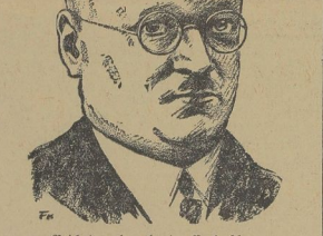
Reichsaussenminister C. Wolff.

Der zweite Vorstoß der Wirtschaftspartei, auf unter aufstrebenderen Wirtschaftskreisen als keine Partei amtierend, da er sich von dem ersten Vorstoß den Dreibund brüskiert hätte.