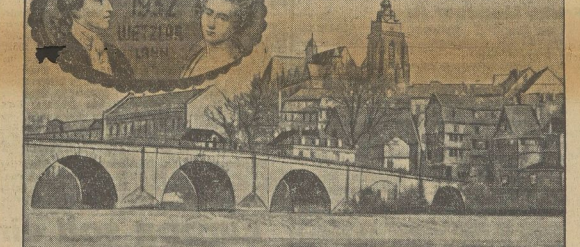
Weglar wird für das Goethe-Jahr 1932. In der Stadt Weglar, die den jungen Goethe und Charlotte Buff zeigt.