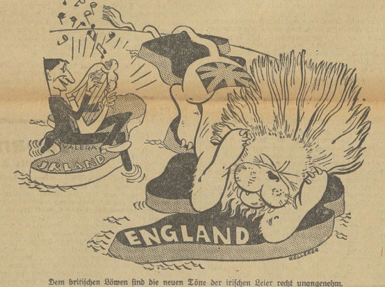
Dem britischen Völkern sind die neuen Löwe der irischen Leier recht unangenehm.