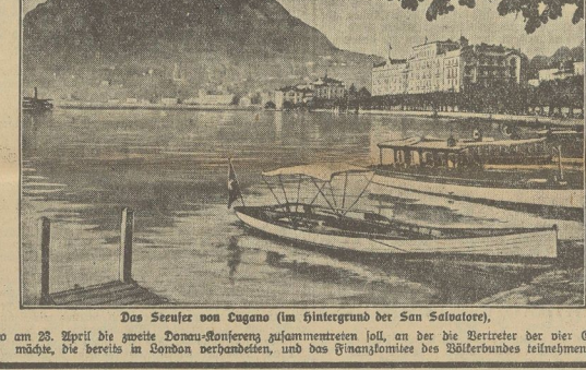
Das Ministerium des Innern (Hintergrund der San Salvador), am 23. April die zweite Donau-Konferenz zusammenrufen...