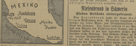
Karte des mittelamerikanischen Staates Mexiko mit den am schwersten betroffenen Städten. Ein schweres Erdbeben hat Mexiko heimgefahren. Viele Städte wurden vernichtet, 500 Einwohner sollen den Tod gefunden haben.