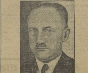
Dr. Diem, der Förderer der deutschen Sportbewegung, 50 Jahre alt.