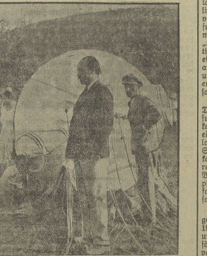
Ein Bild vom Hügeland in der Provinz Mantua in Oberitalien, wo Professor Piccard nach seinem zweiten Stratosphärenflug niederging.