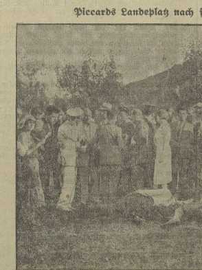
Ein Bild vom Hügeland in der Provinz Mantua in Oberitalien, wo Professor Piccard nach seinem zweiten Stratosphärenflug niederging.