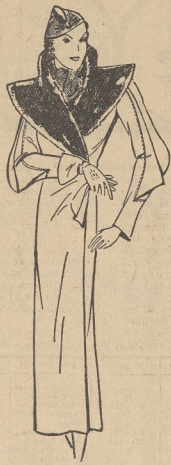
Modischer Mantel aus reinwollenem Bouclé, Seal-Electric-Kragen, ganz aufsteppmarocain 49 50