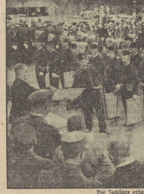
Die Jubilarer erhalten ihre Diplome.

Am dem Reichshofbergwerk 'Renzberg' in Oberhausen fand eine Barbara-Fest statt, die mit einer Ehrung der seit Jahrzehnten auf der Grube Beschäftigten die Schuphülle der Bergarbeiter.