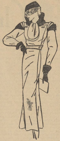
Eleganter Mantel aus Stichelhaar-Bouclé, auf Steppmarocain, Pelzschmuck aus Perlsamerklause 59 00