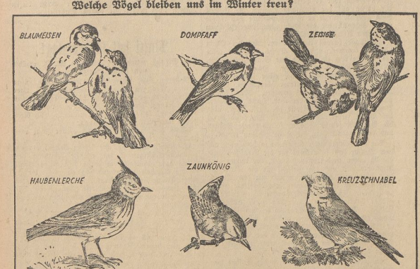
Unsere Zeichnungen zeigen die wichtigsten Eingewanderten, die in unseren Breiten auch im Winter überausen...