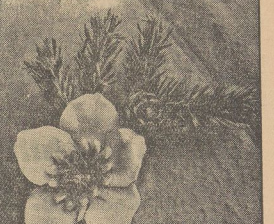
Abbildung rechts: Ansehndes Bild der Winterhilfe für den Monat Dezember. Das niedliche Strohgeschicht zeigt eine Christrose mit einem Tannenzweig.