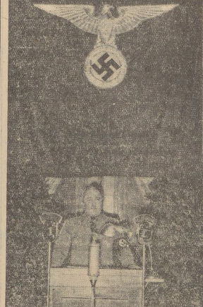
Staatsrat Dr. von der Führer der Deutschen Arbeitsfront, bei der Verleihung der Gold- und Silbermedaille.