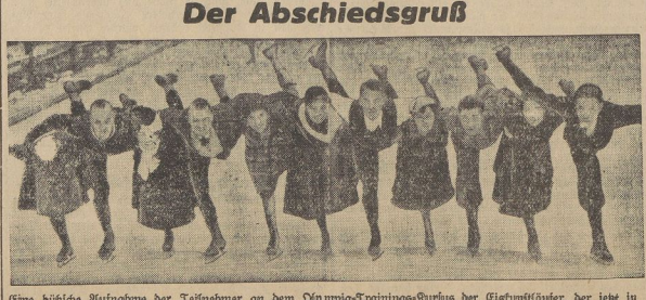
Eine hübsche Aufnahme der Leichtathleten am Olympiastadion...