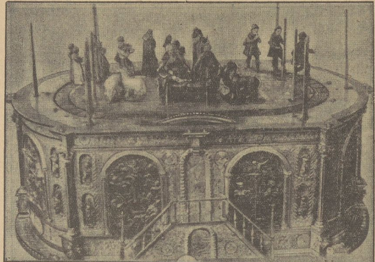
Die Weihnachtsstippe, die Maria und Josef mit dem Kind in der Wiege, die drei Heiligen und die drei Könige mit dem Kind...