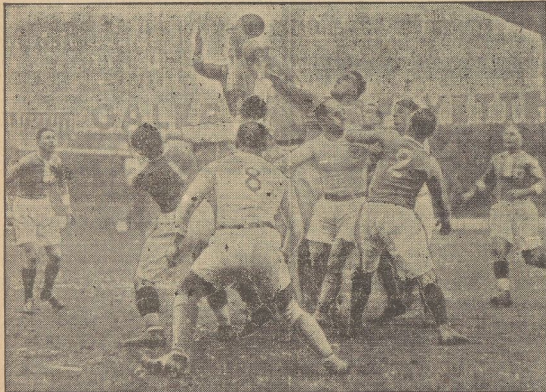
Kampf um das Leder. Die Körper der Spieler haben sich zu einem einzigen dichten Knäuel zusammengedrückt. Da Paris fand als erster Länderkampf des neuen Jahres ein Rugby-Treffen zwischen Deutschland und Frankreich statt, das mit einem 12:3-Sieg der Franzosen endete.