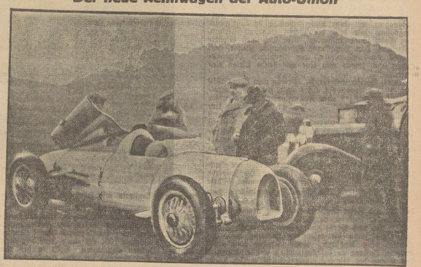
Der mit einem 16-Zylinder-Helmotor versehene Rennwagen, der amtierende technische Neuerungen aufweist, erhielt bereits — ohne voll ausgefahren zu werden — Geschwindigkeiten bis zu 240 Stundenkilometern, und hat eine glänzende Bodenlage.