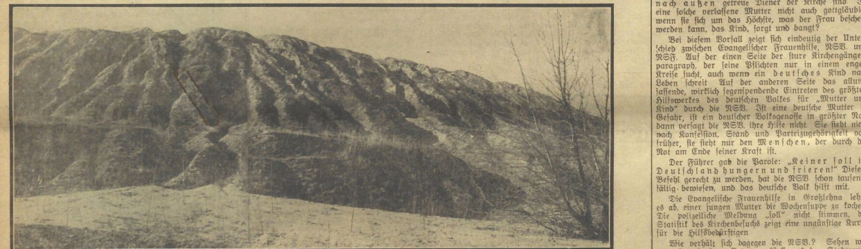
Kein Höhenzug im Geifel - das Bild einer Kuppe in Geifelna.

Sonne liegt über dem Land der Geifel. Der Wind... Sonne liegt über dem Land der Geifel. Der Wind