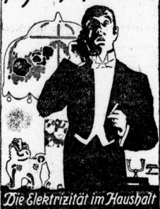
Die Elektrizität im Haushalt

Vom 22. November 1924 im Neuen Markt Halle