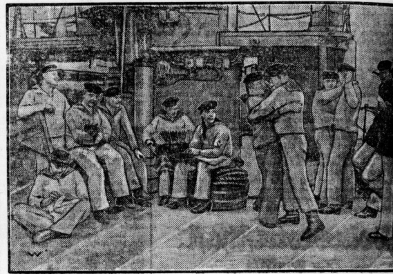
Derzeit in A. 1924.

Wieder deutsche Marine Man kann weder Soldaten noch Matrosen aus dem Wehrkampf. Soldaten kann man schließlich heranzubilden, man kann den natürlichen Kampfsinn, der dem Menschen innewohnt, entwickeln und disziplinieren. Aber gute Matrosen zu gewinnen, ist nicht ein erzieherisches Problem. Der Landmann wird nicht ohne weiteres durch Anstrichung und ein paar Jahre Gewöhnung Matrose. Das Material, aus dem brauchbares Material für die Kriegsmarine geschöpft wird, kann nur eine jugendliche, gesunde Küstenbevölkerung sein, die in ihrem