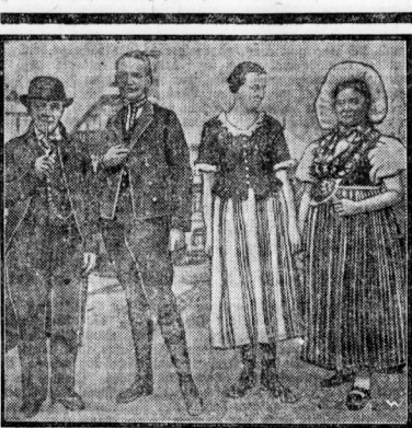
Krummhübel in Berlin