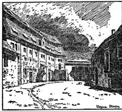
Hof der Unterburg Wettin