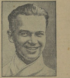
Rudolf Caracciola, der deutsche Europa-Rennfahrer, siegte bei den großen 1000 Meilen - Rennen.