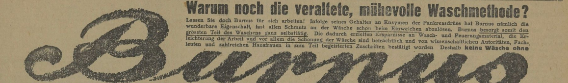
Warum noch die veraltete, mühevolle Waschmethode? Lassen Sie doch Burns für sich arbeiten!