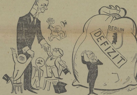
Dr. Schum, der neue Oberbürgermeister von Berlin, hat die beträchtliche Körpergröße von 2,15 Meter. Sein neues „Oberhaupt“ — und das noch größer ist als der neue Oberbürgermeister.

Berlin hat den „größten“ Oberbürgermeister der Welt. Berlin hat den „größten“ Oberbürgermeister der Welt.