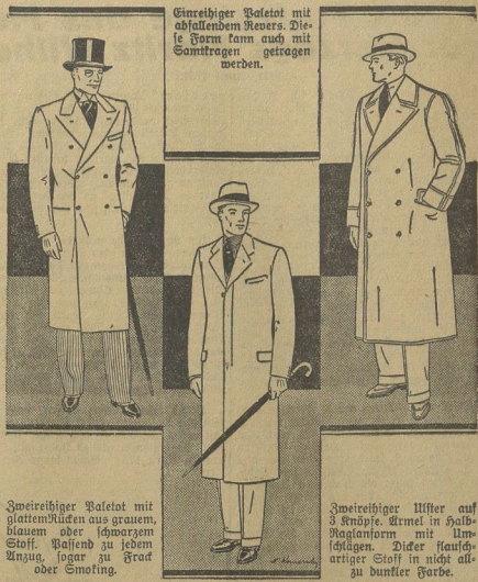
Zweireihiger Paletot mit glattem Kragen aus grauem, dünnem oder schwarzem Stoff. Kragen zu jedem Anzug, sogar zu Grad oder Smoking.

Pflichterfüllung und natürlicher Verzeugsbildung. Die moderne Mannschonung ändert nur Kleinigkeiten. Der moderne Mann kann, ohne von dem Nimbus seiner Männlichkeit auch nur das Geringste einzubüßen, gegebenenfalls seiner Frau bei allen häuslichen Beschäftigungen helfen. Das hat sich durch die Einarbeitung der berufstätigen Frauen eingeführt und ist in fast allen Kreisen angenommen worden. Sobald jedoch die jährlingende Hände der häuslichen Mann und Frau nicht mehr umgeben, trägt die veränderte Lebensauffassung manchen Zweifel in die Ausübung des Benehmens vom Herrn zur Dame. Die veränderten Bedürfnisse der berufstätigen Frauen haben es ferner mit sich gebracht, daß Herr und Dame gemeinsam ein Hotel besuchen, auch wenn nicht herliche oder familienhafte Beziehungen zwischen ihnen bestehen. Besprechungen, wichtige Mitteilungen werden neuerdings oft am dritten Ort getätigt.