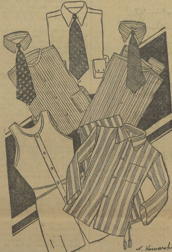
Oben: Das Sporthemd aus Oxfordstoff mit festem, spitzen Kragen und runden Manschetten. Darunter: Gestreifte Hemden mit vollen Kragen, links der meiste Vordringende, rechts ein gestreifter Kragen, der mit Nadel zu tragen ist. Unten: Bekommt Kombination aus porzellanfarbigem Stoff, fönend für das Hemd, rechts der gestreifte Kragen mit gestreiftem Kragen.