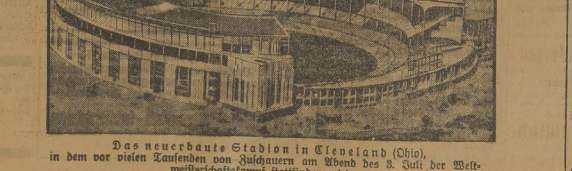
Das neuerbaute Stadion in Cleveland (Ohio), in dem vor vielen Tausenden von Zuschauern am Abend des 3. Juli der Weltmeistertitel verteidigt werden wird.