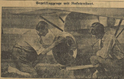
Das Einsetzen der Startrolle in das Segelflugzeug.