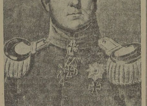
August Graf Reichardt von Gneisenau

Die Projekte der englischen Regierung, mit Rotterdam, Schabbau und neuen Steuern der Finanzkräfte Deutschlands, werden in der öffentlichen Meinung nicht gut aufgenommen.