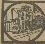
Goh. Kommerzienrat Dr. Ing. h. c. Ernst v. Borsig, den Vorsitz der Vereinigung deutscher Arbeitgeberverbände nieder.