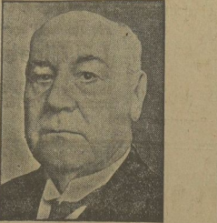
Goh. Kommerzienrat Dr. Ing. h. c. Ernst v. Borsig, den Vorsitz der Vereinigung deutscher Arbeitgeberverbände, den er seit 1925 führt, nach Ablauf des Winters aus Gesundheitsrückgründen niederzulegen.