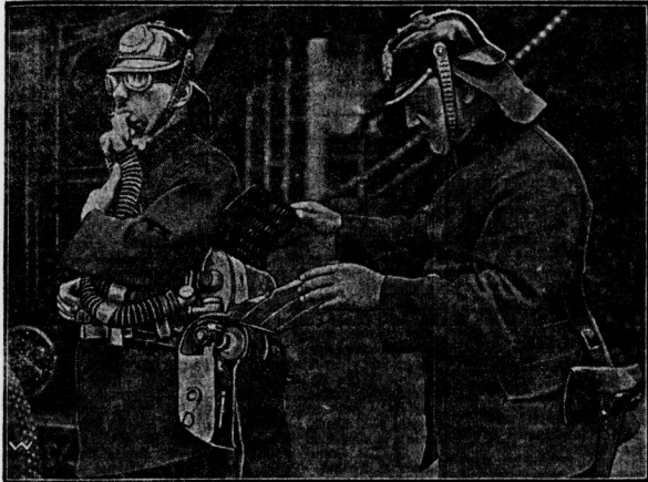
Das Rauchschußmittel der Berliner Feuerweh ist in letzter Zeit um ein neues System bereichert worden. Es ist der langsame atmische Drucker. Bei diesem Apparat ist der Feuerwehmann den zur Atmung nötigen Sauerstoff umgeben bei sich. Die Menge der Atmung des Sauerstoffes ist durch einen Ventilsystem reguliert. Der Apparat ist in der Hand zu führen und dabei angenehm. Der oben abgebildete Apparat hat sich auch bei Feuerwehmann bewährt.