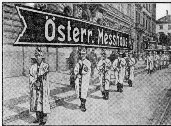
Ausgestellte Messmetreger des österreichischen Messhauses.