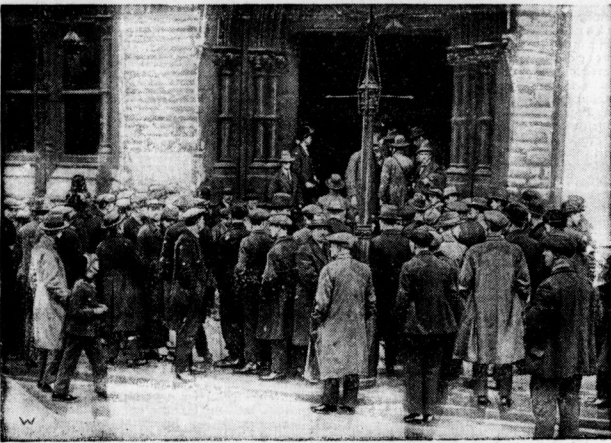
Streikende Arbeiter vor dem Londoner Gewerkschaftshaus.