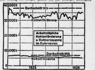
Arbeitstädtische Kohlenförderung u. Kokserzeugung in Ruhrrevier.