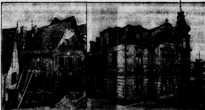
Auf der Stätte des Vorbegehimmels von Kufmbach