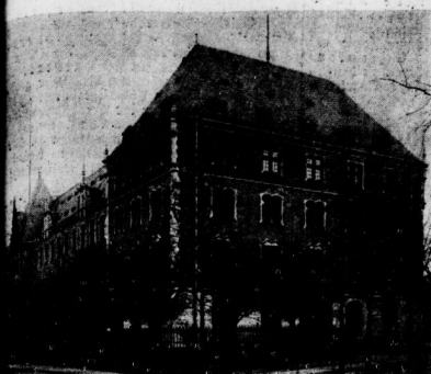
Ein neuer Flügel am Umbau

Als erste Etappe des kommenden großen Hauptbahnhof-Umbaus