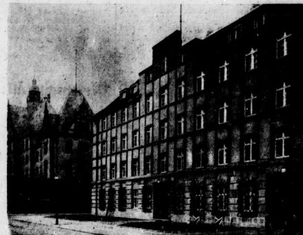
Das neue Verwaltungsgebäude

Das schnelle und bisher immer noch nicht vollendete Umbau des Fabriklokalen Lennardstraße die Frage des An- und Abtransportes der Arbeiter und Angehörigen immer wichtiger gestaltet. So ist z. B. die Hallesche Halle - Weisenhof zur Zeit so stark überfüllt, daß hier ein vierstöckiger Ausbau zur weitestgehenden Notwendigkeit geworden ist. Man über damit die Errichtung eines dreistöckigen auf dem halleschen Hauptbahnhofes, muß zunächst einmal vorläufige Absprachen zwischen Eisenbahn und dem städtischen Rat getroffen werden. In dem Raum geschaffen werden. Die Bauelemente müssen jedoch folgende Eigenschaften abgeben: das Wohnhaus muß über die Straße 6 auf der Höhe neben Hotel „Halle“, das Dienstgebäude der Kammer mit den notwendigen Nebenräumen, das Dienstgebäude am alten Bahnhof 1, das alte Dienstgebäude, das jetzt für Büro- und Wohnzwecke benutzt wird und zugleich als Ausgangspunkt für den Ausbau nach der Eisenbahn dient, das Dienstgebäude des Bauamtes 1, mehrere Dienstgebäude des Bahnhofsamtes, das Dienstgebäude der Bahnhofsverwaltung, die zuletzt als Wohnzwecke verwendet wurde.