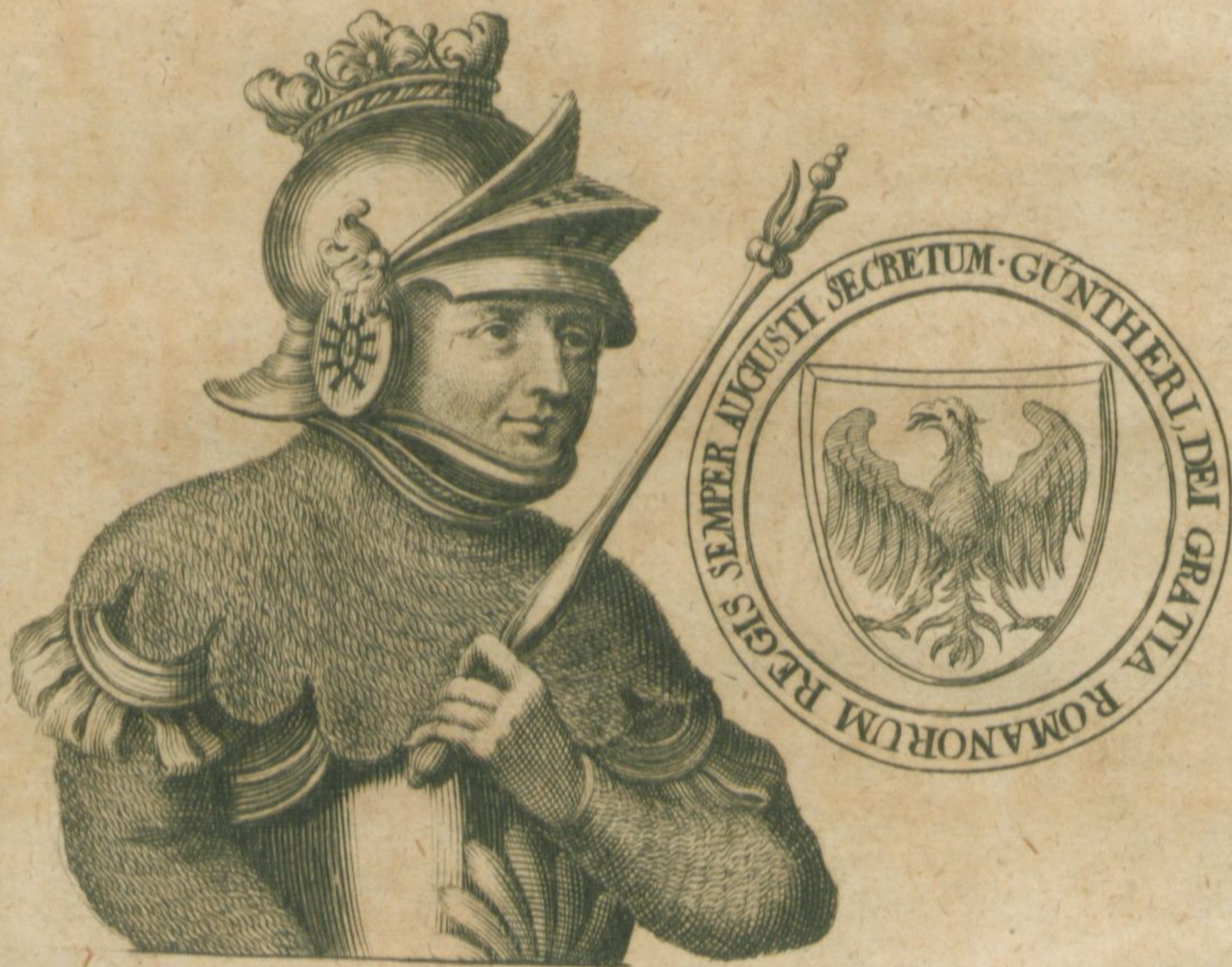
Imago Güntheri Schwarzburgici, Imperatois Romani.