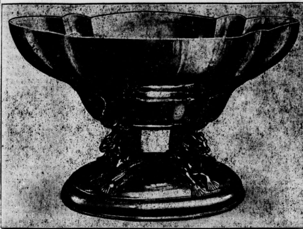
Der „Wanderpreis der Halleischen Zeitung“