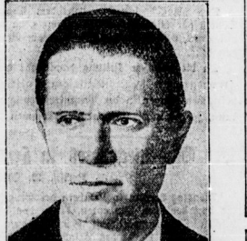
Portrait of a man, likely related to the 'Goldmacher Tausend' article.