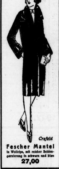
Fescher Mantel in Wolllin, mit reicher Seidengarnierung in schwarz und blau 27,00

zeigt Ihnen die neuesten Mäntel zu wirklich billigen Preisen!