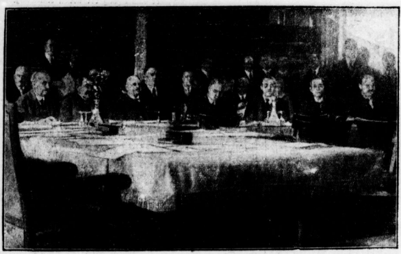
Ratsführung des Völkerverbundes in Gensf. Der zweite von links Triand, dann Streifjemand, Drummond und Chamberlain.