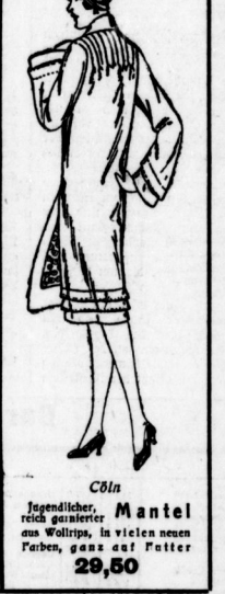
Cöln Jugendlicher, reich garnierter Mantel aus Wolllin, in vielen neuen Farben, ganz auf Futter 29,50