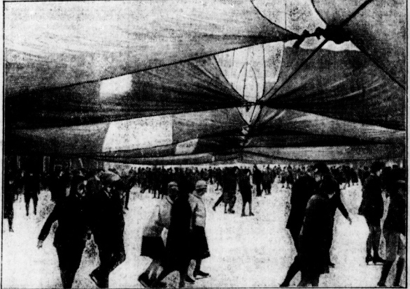
Die Wiener Eislaufplätze werden bei eintretender wärmerer Temperatur durch niedrige Sonnenlage geföhrt, so daß die Wiener selbst bei 6 Grad Wärme im Freien nicht zu verzichten brauchen.

die Halle'sche Turnerschaft im Rahmen der D. T. das bleiben, was sie ist und was sie bleiben soll: eine große Vereinigungsgemeinschaft deutscher Männer und Frauen!