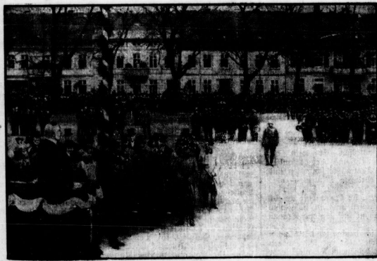
Das 2. Bataillon des Reichswehreinfermentierregiments Nr. 5 zog in diesen Tagen unter freudiger Anteilnahme der Bevölkerung und in Gegenwart des Reichswehrministers Goerner und der Spitzen der Militär- und Zivilbehörden in seine neue Garnison Neuruppin ein.