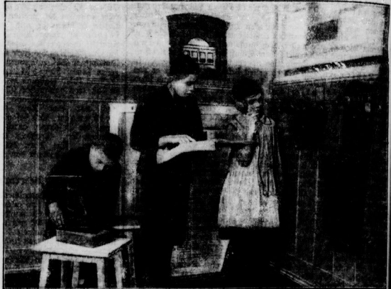
Die Kinder beim praktischen Postunterricht.

In einer Gemeindefabrik im Berliner Osten wurde das erste Mutterschulzimmer für Verkehrsunterricht in den Schulen eröffnet nach dem Prinzip: „Die beste Lösung der Verkehrsprobleme ist die breite Masse zur Verkehrsdisziplin zu erziehen.“