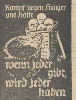
Kampf gegen Hunger und Kälte