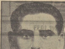
Der Ministerialrat Rudolf Tertil, ein ehemaliger Sekretär des österreichischen Bundeskanzlers.