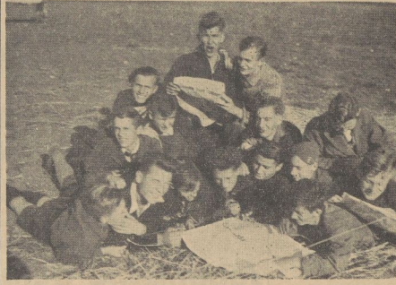
In Laucha schaut auch Merseburger Jugend. Unser Bild zeigt den Merseburger Segelflieger nachmittags in einer „sechsig“-Bauweise. Eben ist das Merseburger Heimblatt angekommen. Der Bericht über das Fliegen an den Lufttrübungen wurde eifrig studiert.