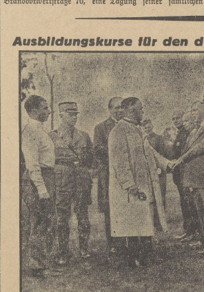
Reichsportführer von Lippmann-Osten (im weißen Anzug) beaufsichtigt die Teilnehmer. Am Deutschen Stadion in Berlin begann in Anwesenheit des Reichsportführers von Lippmann-Osten der erste Lehrgang für den Olympia-Nachwuchs, an dem 500 junge Sportler aus allen Teilen des Reiches teilnahmen. Der Kurkurs, dessen Leitung in den Händen des Reichsportleiters Ratz liegt, verfolgt das Ziel, neue Talente für die Olympischen Spiele 1936 zu finden und zu fördern.