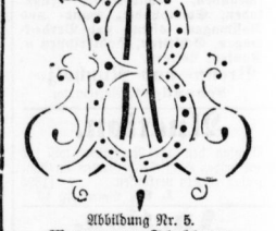
Abbildung Nr. 5. Monogramme-Schablonen. Nr. 4, kleiner als Abbildung 5, 25 Bld. Nr. 5, genau wie Abbildung 5, 30 Bld. Nr. 6, größer als Abbildung 5, 40 Bld.

Abbildung Nr. 2. Monogramme-Schablonen. Nr. 1, kleiner als Abbildung 2, 15 Bld. Nr. 2, genau wie Abbildung 2, 15 Bld. Nr. 3, größer als Abbildung 2, 20 Bld.