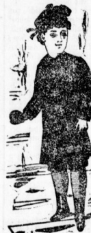
Knaben-Anzüge , vom einfachsten bis zum elegantesten Genre, bis zu 16 Jahren.