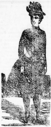
Mädchen-Paletots sowohl für kleine als auch für erwachsene bis zu 16 Jahren, vom einfachsten bis zum elegantesten Genre. Mittel-Genre von M. 5.00 an.