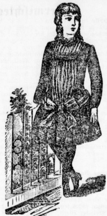
Tricot-Kleider für Mädchen von 1 bis 16 Jahren, in überraschend reicher Auswahl. Winter-Tricotkleider von 8 M. an.