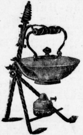
Theeständer Nickel oder Kupfer.