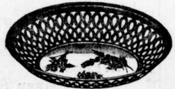
Brod- oder Frühstückskorb mit dunkler Favence-Einlage, ff. vernickelt, in nur neuen Decors.