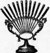
Obstmesser mit Ständer.