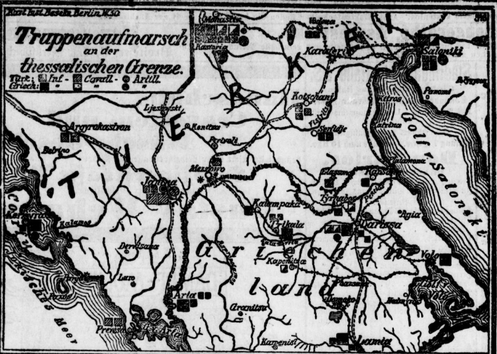
Hals es zu einem Konflikt zwischen der Türkei und Griechenland kommen sollte, was noch zweifelhaft ist, so wird sich derselbe an der