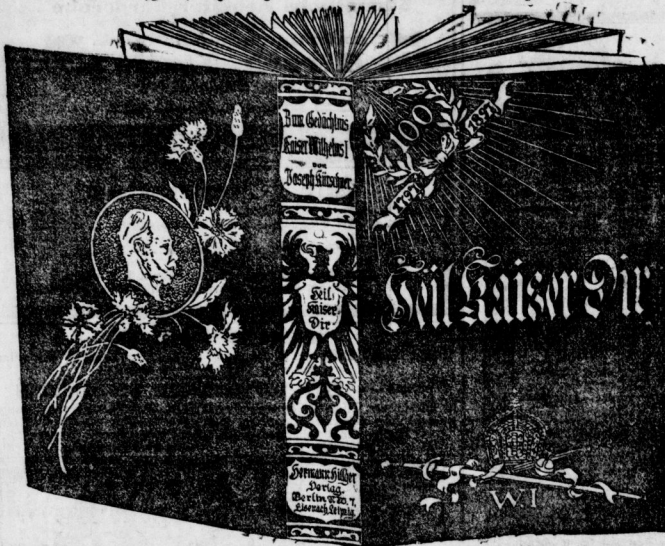
(Originalgröße, im Original farbig.)

Die billigste, stoffreichste, am meisten instructive Lebensgeschichte Kaiser Wilhelms I. ip