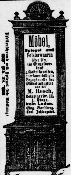
Spezialerkrankung mit Spiegel (eine Abbildung)