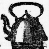
Belaganzuhr, bestehend aus starken Eis. Gefäß, emall. Schüssel, Seitenwand, Wellertrug, auf 2 Rth. 50 Pf.