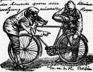
Expire-Fahrrad M. M. v. H. Berlin

Siehe Sie, das ist der grosse Vorzug kein „Expire“ Rad, dass man während der Fahrt nicht beunruhigt sein oder Verletzung vermeiden kann