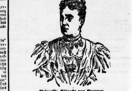
Prinzessin Albrecht von Preußen.