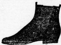
Herren-Leder-Zugstiefel von Mk. 5.80 an,