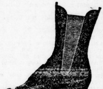
Damen-Leder-Zugstiefel von Mk. 2.90 an,