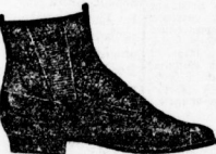
Herren-Leder-Besatzstiefel von Mk. 3.90 an,