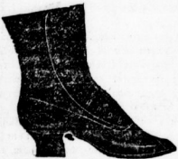
Damen-Leder-Knopfstiefel von Mk. 5.80 an,